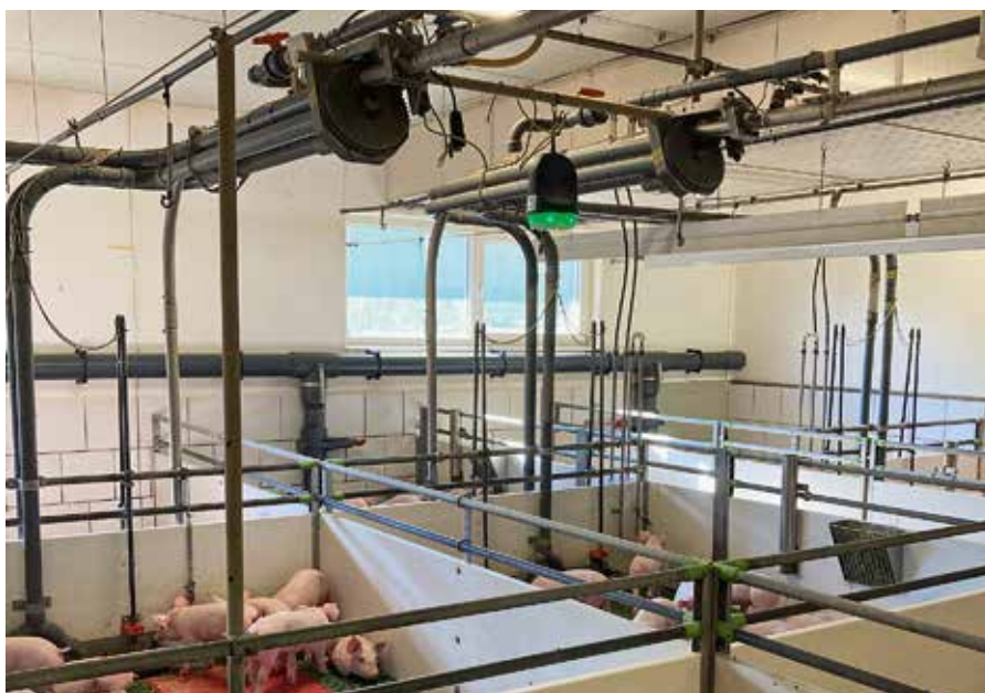
Die Monitore erkennen wenn kein Atemwegsproblem im Stall vorliegt, solange leuchten sie grün. Das gibt einen schnellen Überblick wenn man das Abteil betritt.

Seit Kurzem bietet Boehringer Ingelheim Schweinehaltern das neue Frühwarnsystem „SoundTalks®“ zur Überwachung von Atemwegsproblemen wie Husten, Temperatur und Luftfeuchtigkeit an. Dabei handelt es sich um ein Monitoring-System, welches Geräusche im Stall erfasst und mittels künstlicher Intelligenz analysiert. Alle Daten werden 24 Stunden am Tag, sieben Tage die Woche (24/7) aufgezeichnet. Mit Hilfe eines Algorithmus kann diese Masse an Daten sehr schnell bewertet werden: